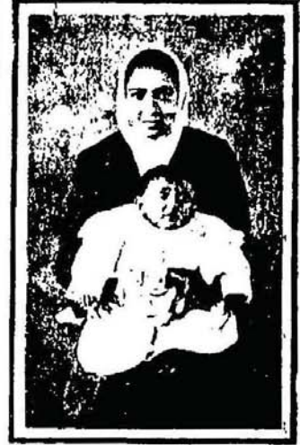
ان چار جانباڑ ہندوستانی عورتوں میں سے ایک عورت جو جاہلانہ قانون ہا مقابلہ کرنے کیلئے کنیڈا میں داخل ہو گئی ہیں !

لڑکی شخص ایسا ہوا جسکو یہ دہرا نہ ہوگا کہ اس کے قریب اور محبوب رشتہ داروں میں سے کوئی نہ لڑکی سر فروش اس سلطنت کے لیے اپنا خون بہا چکا ہے جس کے تاج سلطنت کا سب سے زیادہ قیمتی نگینہ ہندوستان ہے - بہر حال اس بحث پر چہرے نہ کہ سکھوں کے حقوق ایک وفادار برطانی سپاہی ہونے کی حیثیت سے خاص نوعیت ارکھتے ہیں - عام قومی اور قانونی لحاظ سے دیکھو - جب بھی یہ ایک نہایت ہی انسرناگ اور ناقابل تحمل منظر ہے - ہندوستان ہی کے باشندے ہیں جنہوں کے محنت و مزدوری کر کے ان نوابانوں کو یورپ کی دار الحکومتوں کا ہم سربنا دیا ہے - لیکن آج نہایت کے درجے کے ساتھ ان پر اسکا دروازہ بند کیا جا رہا ہے - بظاہر ایسے پر قریب قواعد وضع کیے گئے ہیں جسے معلوم ہوتا ہے کہ یہ دروازہ چند راتوں کے ساتھ بند کیا گیا ہے - مگر فی الحقیقت وہ