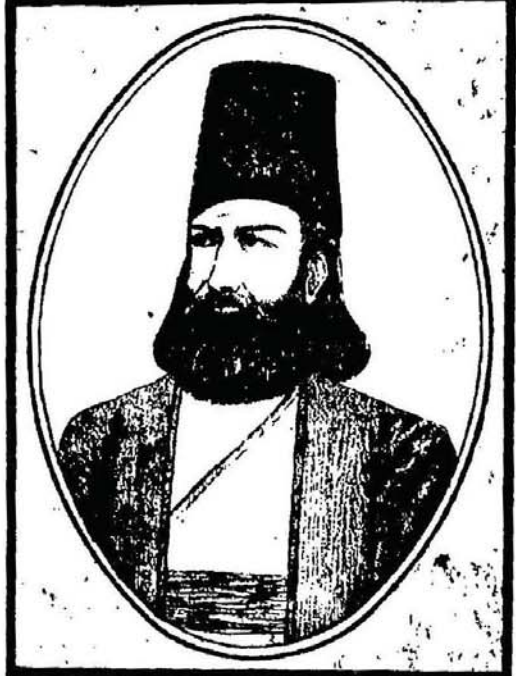
حکیم عمر الحیام (۱)

اصل یہ ہے کہ الحاقی دلام کا سوال صرف خیام ہی تک محدود نہیں ہے بلکہ ایک حد تک عام ہے۔ الحاقی منسوبات کی عام بلا سے شاید ہی کوئی مشہور شاعر بچا ہو۔ اس درجہ سے بھی نظر بلند کر کیجیے اور عام طبقہ مشاہیر و اعظم مصنفین منقذین و متوسطین کو دیکھیے تو ہر علم و فن کے ارباب کمال اسی مدیبت سے درچار نظر آئیں گے۔ آج کتنی ہی تصنیفات ہیں جو امام ابن حنیفہ، جابر طرطوسی، ابن قتیبہ، امام غزالی، ابر معشر نلکی، فخر الدین رازی، بوعلی سینا، معلم ثانی، ابن عربی، محقق طوسی زغیرہ سے منسوب ہیں