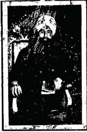
سردار تیجا سنگھ جو کنیڈا کے نوابان ہندوستانیوں کے ایک با اثر لیڈر ہیں -