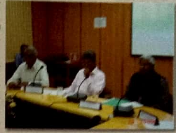
شہزادہ اردو کی ترقی کی سب سے بڑی مثال بن گئے تھے۔ ان خیالات کا اظہار ممتاز شاعر ادیب اور نگار پروفسر شہزاد (معلم امراؤ جان کے مشہور گیت کار) نے اردو کی ترقی میں ایک اہم اور نئی نکتہ سے تعلق کرتے ہوئے کیا۔ شہزادہ اردو نے سابقہ انگریزی اور اردو کے درمیان میں اردو کی ترقی میں ایک نیا اور نیا رخ پیدا کیا۔

ہندوستان میں اردو زبان کا سورج موصوف اور سخیل نہایت امید افزا ہے۔ اہل اردو کو اپنی زبان کے تعلق سے یوں ہی فطری ضرورت نہیں ہے۔ ہندوستان میں مولانا آزاد پچیس برسوں پہلے اردو کی ترقی کی سب سے بڑی مثال بن گئے تھے۔ ان خیالات کا اظہار ممتاز شاعر ادیب اور نگار پروفسر شہزاد (معلم امراؤ جان کے مشہور گیت کار) نے اردو کی ترقی میں ایک اہم اور نئی نکتہ سے تعلق کرتے ہوئے کیا۔ شہزادہ اردو نے سابقہ انگریزی اور اردو کے درمیان میں اردو کی ترقی میں ایک نیا اور نیا رخ پیدا کیا۔ ممتاز شاعر نے اردو کی ترقی میں ایک نیا اور نیا رخ پیدا کیا۔ ممتاز شاعر نے اردو کی ترقی میں ایک نیا اور نیا رخ پیدا کیا۔