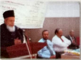
شہزادہ اردو کی ترقی کی سب سے بڑی مثال بن گئے تھے۔ ان خیالات کا اظہار ممتاز شاعر ادیب اور نگار پروفسر شہزاد (معلم امراؤ جان کے مشہور گیت کار) نے اردو کی ترقی میں ایک اہم اور نئی نکتہ سے تعلق کرتے ہوئے کیا۔ شہزادہ اردو نے سابقہ انگریزی اور اردو کے درمیان میں اردو کی ترقی میں ایک نیا اور نیا رخ پیدا کیا۔