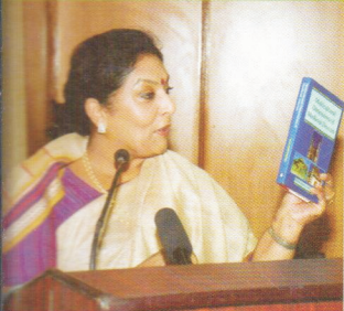
Renuka Chaudhury on Multiculturalism