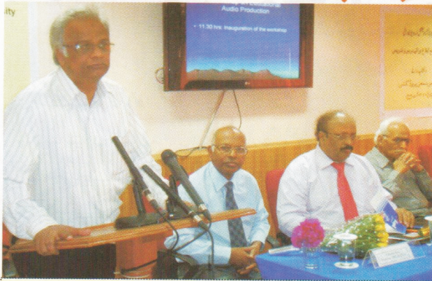
پروفیسر ایس اے وہاب، ورکشاپ کے افتتاحی اجلاس سے خطاب کرتے ہوئے۔ پروفیسر منظور الہ مین، پروفیسر اقبال احمد اور جناب وی راماراؤ شیشین پر